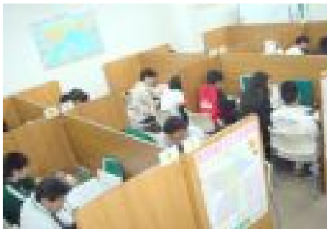
【 授業風景 】

大学受験を控えている高校3年生が朝から晩まで教室で勉強していました。1日に4コマから5コマ授業を受け、その合間に自習で自分の勉強を進めていました。センター試験（1月17・18日）を皮切りに2月にかけて入試が行なわれるため、今までにないくらいの頑張りを見せていたのが印象に残りました。他学年の生徒も早めに教室に来て自習をしていた姿も見られたため、今後の成長が楽しみです。